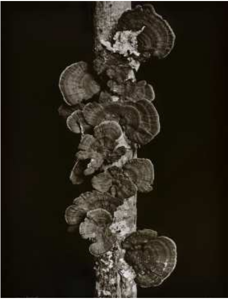
Denis Brihat, Champignons sur une branche , 1991. Tirage argentique et gravure photographique, 40 x 50 cm BnF, Estampes et photographie © Denis Brihat