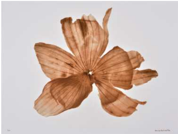
Denis Brihat, Pelure d'oignon , 2002 Tirage argentique, virage à l'or, 50 x 60 cm BnF, Estampes et photographie © Denis Brihat