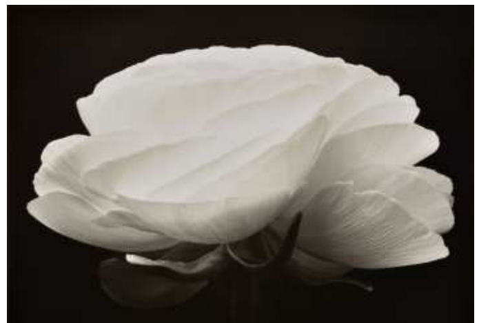
Denis Brihat, Gardénia , 2001 Tirage argentique, sulfuration, 40 x 50 cm BnF, Estampes et photographie