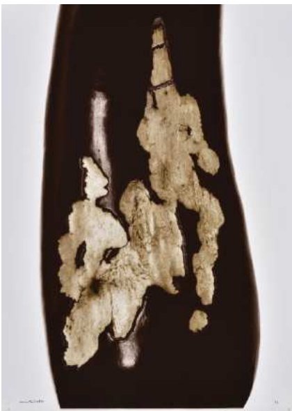
Denis Brihat, Aubergine , 2006 Tirage argentique, virage au sélénium, 40 x 60 cm BnF, Estampes et photographie