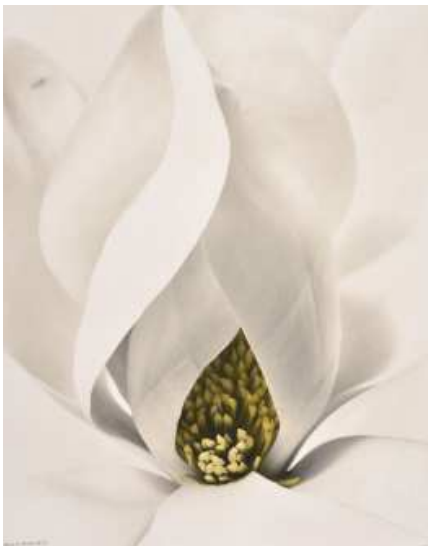
Denis Brihat, Cœur de magnolia , 1999 Tirage argentique, virage local à l'antimoine et sulfuration, 50 x 40 cm BnF, Estampes et photographie © Denis Brihat