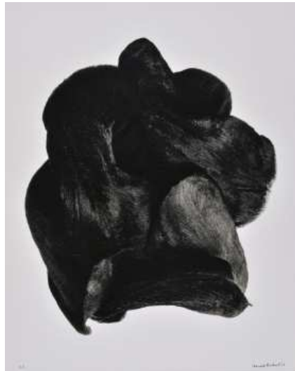
Denis Brihat, Tulipe noire , 1977 Tirage argentique, virage au sélénium, 40 x 50 cm BnF, Estampes et photographie