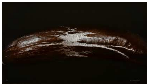
Denis Brihat, Traces sur l'aubergine , 1997 Tirage argentique, virage au sélénium, 45 x 60 cm BnF, Estampes et photographie