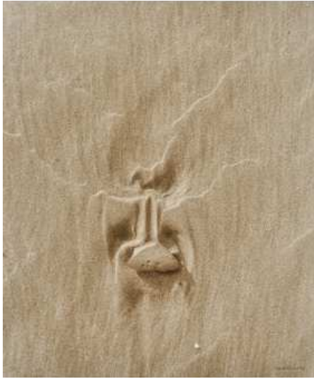
Denis Brihat, Sables , 1991 Tirage argentique et sulfuration, 80 x 60 cm BnF, Estampes et photographie © Denis Brihat