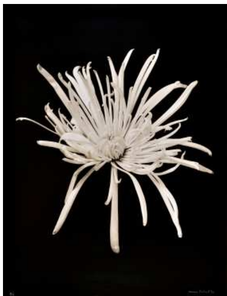
Denis Brihat, Chrysanthème , 1986 Tirage argentique, sulfuration, pigmentation du fond, 50 x 40 cm BnF, Estampes et photographie © Denis Brihat