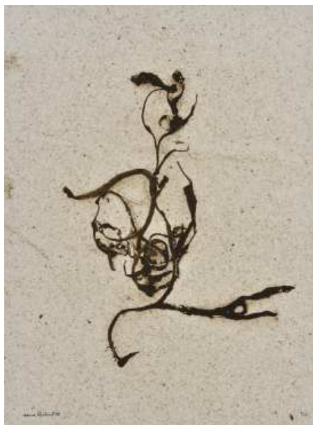
Denis Brihat, Sables , 1998 Tirage argentique et sulfuration, 30 x 40 cm