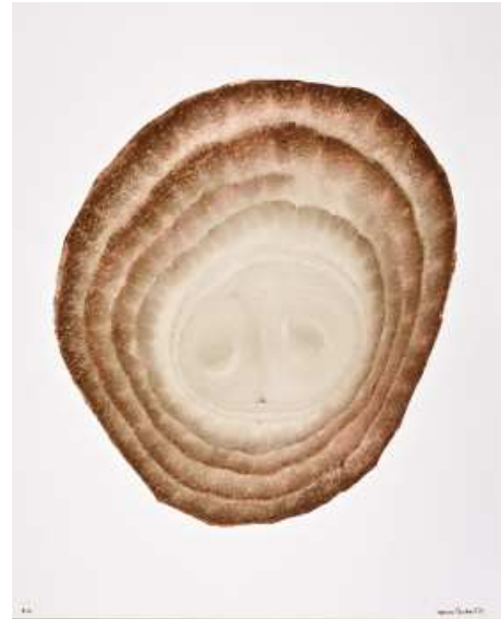
Denis Brihat, Rondelle d'oignon , 1971 Tirage argentique, virage à l'or, 60 x 50 cm BnF, Estampes et photographie © Denis Brihat