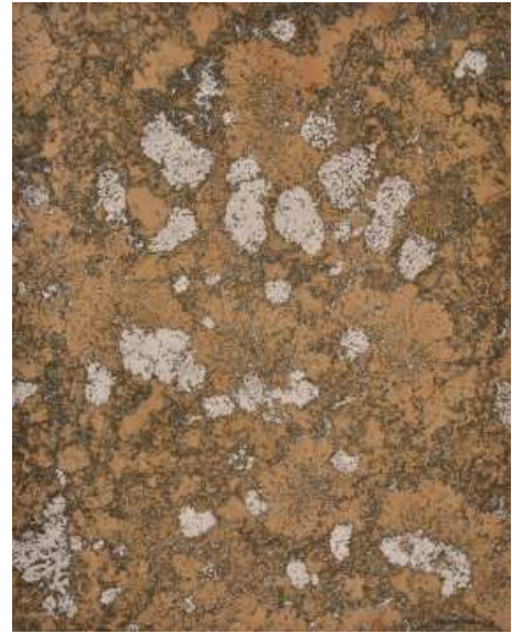
Denis Brihat, Lichens , 1972 Tirage argentique, gravure photographique, oxydation, 40 x 50 cm BnF, Estampes et photographie