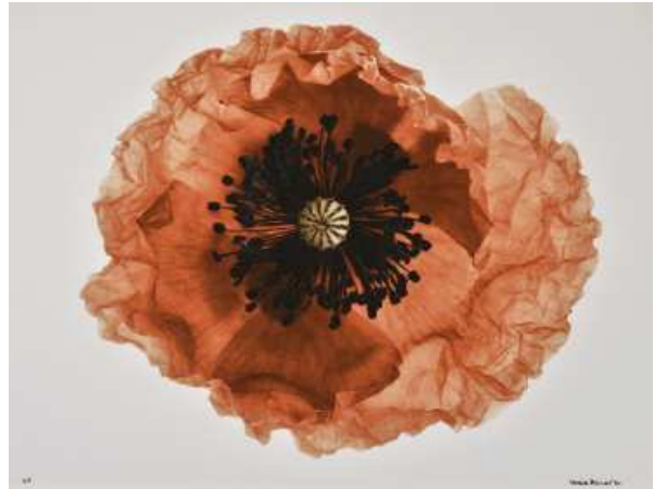
Denis Brihat, Coquelicot fripé , 1994 Tirage argentique, virage à l'or, 30 x 40 cm BnF, Estampes et photographie